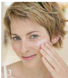
Защита в течение дня

Крем для лица „Rosenscreme“, Крем для лица „Rosenscreme leicht“, Увлажняющее молочко для лица (Gesichtsmilch), Айвовый крем для лица (Gesichtscreme Quitte)